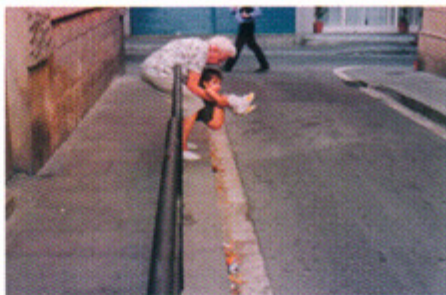
Sin título, Antoni Tomás.