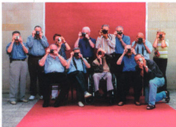
Alumnos del curso Punt de vista.