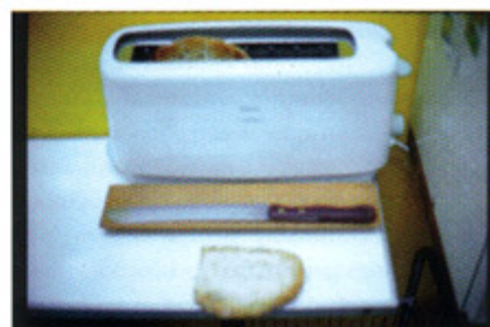
Tostadora, Jordi Cucurull.

lujuria o el deseo. Poco a poco, la foto postal bonita y aséptica, tan habitual al principio del curso, dio paso a un tipo de imágenes más personales.