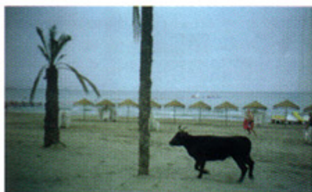
Toro, Nieves de Abajo.